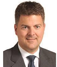
Andreas Schwab (PPE, Alemania)

El ponente de la Comisión de Mercado Interior, Andreas Schwab (PPE, DE), subrayó "el buen compromiso encontrado que protegerá el sector de la salud en interés de los ciudadanos de la UE sin dañar el mercado interior al mismo tiempo". Para garantizar que los ciudadanos y las empresas se beneficien plenamente de las normas adecuadas y proporcionadas, los diputados del PE incluyeron una nueva disposición que exige a los Estados miembros que garanticen que la legislación nacional dispone de revisión judicial con respecto a las disposiciones legislativas, reglamentarias o administrativas que restringen el acceso de las profesiones reguladas que entran en el ámbito de esta directiva.