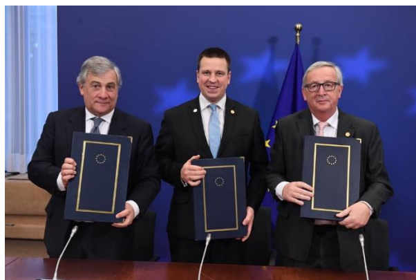
Antonio Tajani (Presidente PE), Jüri Ratas (Primer Ministro estonio y Presidente Consejo) y Jean-Claude Juncker (Presidente CE)

El Consejo, el Parlamento y la Comisión estuvieron de acuerdo en que también es necesario avanzar en otras áreas importantes. Están decididos a seguir su compromiso con los valores europeos comunes, a una política comercial sólida, abierta y basada en normas, y a abordar el fraude fiscal y la evasión fiscal. Otras prioridades incluyen trabajar sobre los principios del Pilar de los Derechos Sociales, reforzar el papel de la UE en el mundo y garantizar un alto nivel de protección de datos, derechos digitales y normas éticas, aprovechando al máximo las oportunidades que ofrecen los desarrollos en inteligencia artificial y robótica.